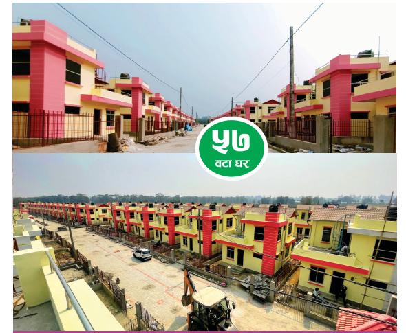
निर्माण सम्पन्न भइ सदस्यहरूलाई वितरण गरिसकिएको